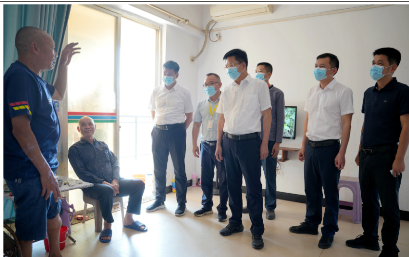
县领导带队深入养老机构督导检查“五一”节前安全生产工作

县领导强调，要深刻吸取河北隆化养老机构火灾事故教训，举一反三、细化举措、压实责任，认真细致做好养老机构火灾隐患排查整治，严防失控漏管，切实做到防患于未然；尤其要针对失能老人等特殊群体，制定完善应急疏散预案，确保紧急情况下能迅速安全逃生。要强化协同联动和宣传发动，广泛