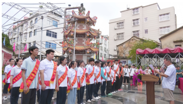
云霄县云山书院举行2024年高考优秀生颁奖仪式现场

本报讯（张滢）8月8日，云霄县云山书院举行2024年高考优秀生颁奖仪式。今年共有32名优秀高考生获奖，每人获得2080元的奖学金。