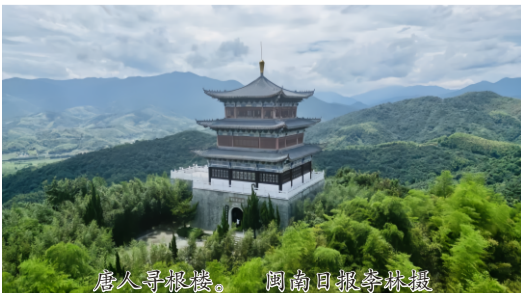
唐人寻根楼。