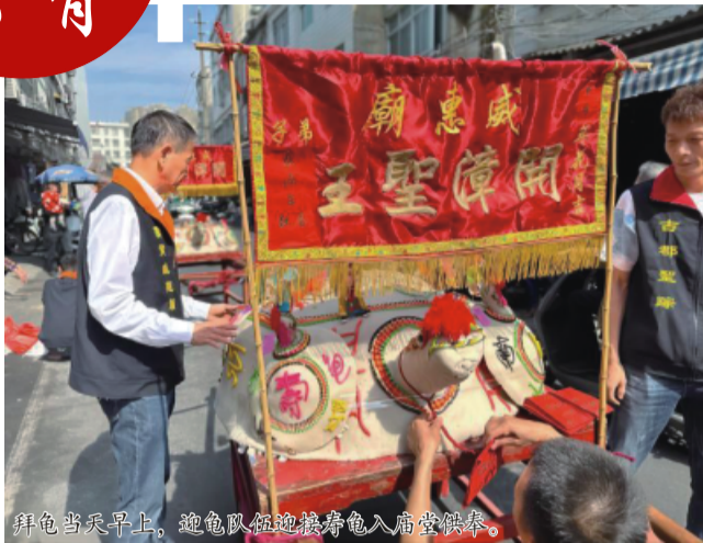
拜龟当天早上，迎龟队伍迎接寿龟入庙堂供奉。

本报讯（谢榕 林亲亲）3月25日晚，在开漳祖庙——云霄威惠庙内，人头攒动，香火鼎盛，热闹非凡。为纪念开漳圣王陈元光诞辰1367周年，这里正在举办一场传承千年的传统民俗活动——“威惠拜龟”。