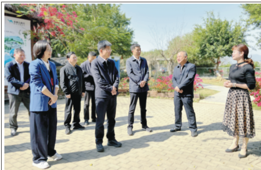
蓝良木一行详细了解乡村旅游特色餐饮住宿经营、网红景点建设等情况