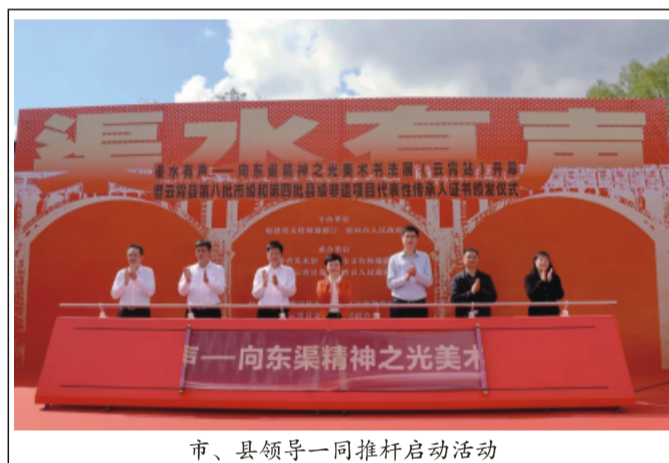
市、县领导一同推杆启动活动

本报讯（郭扬 吴锡坤 冯汪煜 高志坚）2月21日，“渠水有声——向东渠精神之光美术书法展”（云霄站）开幕暨云霄县第八批市级和第四批县级非遗项目代表性传承人证书颁发仪式在云霄县文化馆举行。副市长余向红、市文旅局局长刘晖、县委书记蓝良木、县长沈顺来、省文旅厅艺术处三级调研员杨忠兴、市人大常委会主任林达祥、县政协主席林意纯一同推杆启动活动。