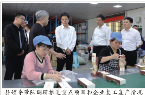
县领导带队调研推进重点项目和企业复工复产情况

县领导强调，全力抓好企业复工复产，是全年开好局、起好步的关键。各级各部门要全面贯彻落实党的二十大精神，聚焦省委、市委和县委各项决策部署，深化拓展“深学争优、敢为争先、实干争效”行