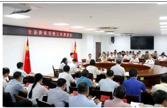
全县招商引资工作推进会现场

会议强调，要明晰招商引资“主路径”。要绘细三大主导产业链招商图谱，对县域资源禀赋、优惠政策、营商环境、产业生态等做到心中有数，聚焦目标企业所思所想所需，主动出击、按“图”索骥，换位