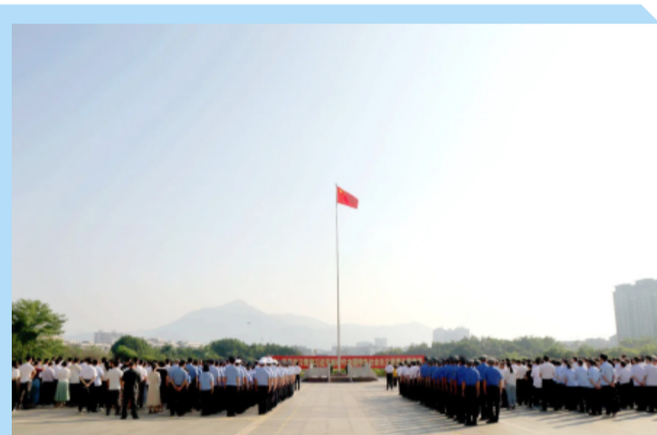
2023年云霄县国庆升国旗仪式现场

回首过去，风雨兼程；展望未来，信念如钢。参加仪式的干部纷纷表示，将坚定不移高举习近平新时代中国特色社会主义思想伟大旗帜，结合开展主题教育，深入学习贯彻党的二十大精神和习近平总书记重要讲话重要指示批示精神，聚焦“深学争优、敢为争先、实干争效”，把握省纪委监委挂钩帮扶的有利时机，以开展“产业发展项目建设提升年”活动、“七比一看”竞赛为抓手，苦干实干加巧干，全力推动县“1320”方案等中心工作取得新成效，为加快富美新云霄现代化建设作出新的更大贡献。