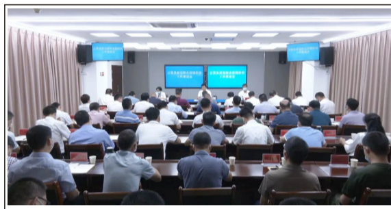
云霄县新冠肺炎疫情防控工作推进会现场

会议强调，要始终紧跟党中央令旗走，坚定不移坚持人民至上、生命至上，坚定不移落实“外防输入、内防反弹”总策略，坚定不移贯彻“动态清零”总方针，落实“疫情要防住、经济要稳住、发展要安