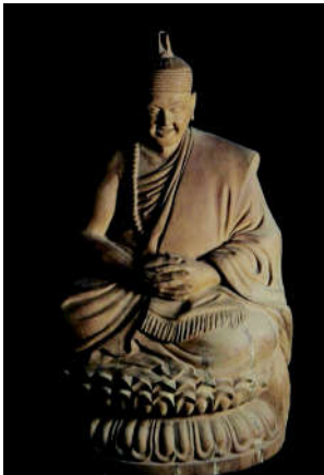
方建武作品《泰国僧人》