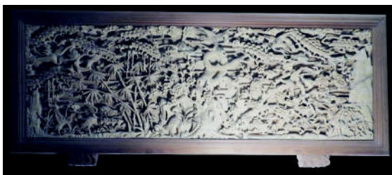
方建武作品《美意延年》