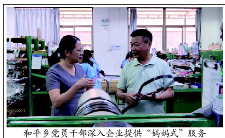
和平乡党员干部深入企业提供“妈妈式”服务

本报讯(徐荫圃 朱淮杰 见习生:吴泓婧 通讯员:郑铭杰) 近段时间,全市“六比一看”竞赛、“千名干部挂千企”帮扶服务活动正如火如荼铺开,党员干部主动帮扶企业,助力企业做大做强,推动“产业发展项目建设年”活动纵深开展。