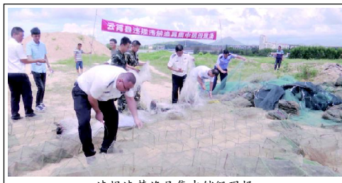
违规禁用渔具集中销毁现场

下一阶段,县海洋与渔业局将持续开展整治涉渔“三无”船舶专项行动,紧密结合海洋伏季休渔监管、“亮剑”“蓝剑”、渔业安全生产大检查、封港清查等行动,加强海上查、岸上堵,严厉打击涉渔乡镇船舶暨涉渔“三无”船舶非法违规捕捞行为,坚持发现一艘、查处一艘、销毁一艘,切实维护全县渔区和谐稳定。