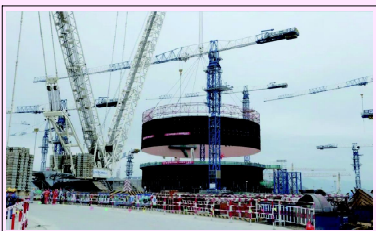
漳州核电2号机组钢衬里模块三吊装安装就位

本报讯 4月27日8点38分，随着钢衬里筒体4段与筒体3段的精准对接，“华龙一号”漳州核电2号机组核岛反应堆厂房钢衬里模块三吊装就位，吊装过程安全、质量整体可控、在控。本次吊装工作为系统工程中的SAFER模型工具在工程中的首次应用，收到了良好的效果。