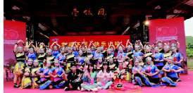
《县老年大学舞蹈队合影》