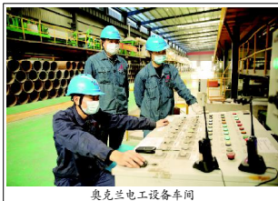
奥克兰工设备车间

今年初，云霄县围绕党史学习教育和“再学习、再调研、再落实”这一主线，聚焦重点区域、重点领