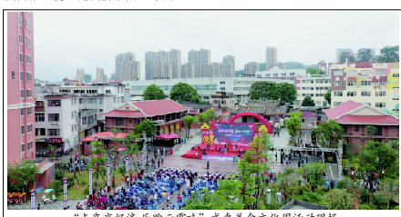
“点亮夜经济 乐购云霄” 威惠美食文化周活动现场

近年来，我县在加快城市开发建设进程中，找准文物保护与改善居民生活环境之间的结合点，在改善新环境、重塑新功能、融合新业态上下功夫，变旧城改造为古城更新，保留城市历史文化记忆，生成激活旅游景点，丰富夜间消费。威惠片区依托闽台文化、寻根文化，以旧“焕”新，为重塑城市功能、重现传统街区活力打造了新样本。既保护好城市历史文化遗址，又把古城风貌与现代新城相辉映。