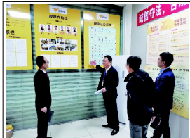
检察官会同县市场监督管理局执法人员实地调查走访

建议发出后，县人民检察院对建议落实情况实时跟踪，确保建议取得实效。县市场监督管理局高度重视，及时跟相关整改工作。截至目前，共排查出有44家外卖餐饮商家单位存在不规范问题，其中完成下架整改15家（次），完成信息更新24家（次），停止网络服务13次。（来源：云霄县人民检察院）