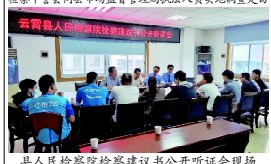
县人民检察院检察建议书公开听证会现场