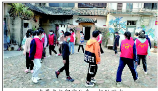
志愿者与留守儿童一起做游戏

近年来，云霄团县委注重整合资源，采用“社+团+社会组织+志愿者”联动模式，为留守儿童提供精准帮扶、心理抚慰、学业辅导、亲情陪伴、兴趣拓展等志愿服务，关爱重点群体健康成长。