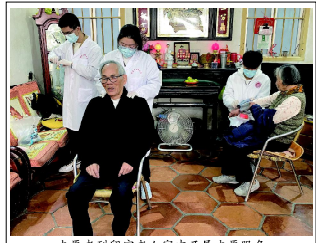
志愿者到留守老人家中开展志愿服务

本报讯 （方利宾）“春节”临近，疫情影响尚未退去，为使留守儿童、留守老人度过一个健康、安全、温暖、幸福、充满爱的假期，依照常态化开展儿童关爱、老人关爱等服务活动工作机制，云霄团县委联合县民政局、县妇联、县自飞青少年社于2月18日在2021年春节期间开展“把爱带回家”——“四送”活动。多位