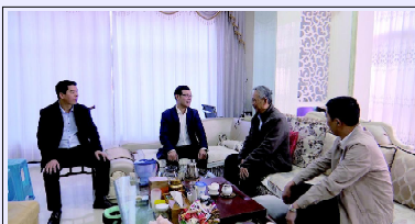
王金狮看望返乡省亲著名物理学家吴青海

本报讯 （吴锦坤 方淑娟）早春的云霄，和风温暖，春光无限。2月19日下午，县委书记王金狮一行专程看望了返乡省亲著名物理学家吴青海，向他致以诚挚的问候和新春祝福。