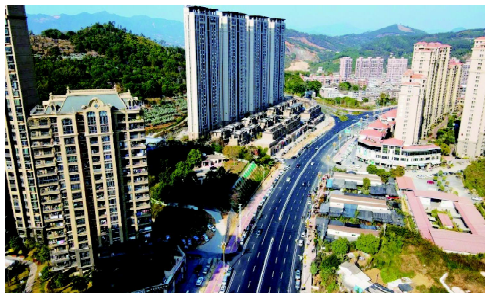
“整容换肤”后的将军大道