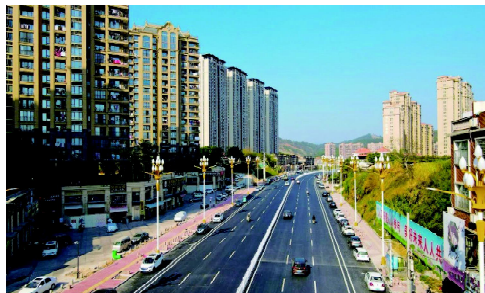
将军大道经历了一场从外表到内涵的全方位“整容”