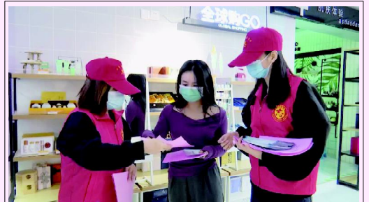
志愿者们向商户发放诚信建设倡议书、消费维权等宣传材料

此次诚信经营示范街“放心消费”主题创建活动，旨在进一步规范市场经济秩序，发挥商业、服务业等窗口行业在文明城市建设中的示范作用，为经营者创造良好的经营发展环境，为消费者营造放心的购物环境。