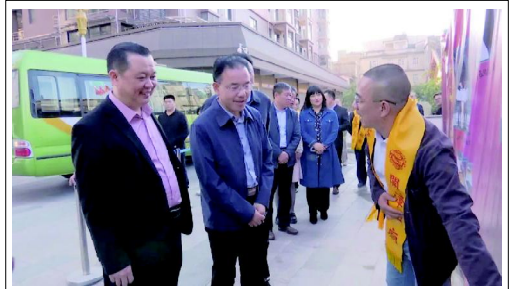
固始县交流团一行前往开漳历史博物馆、燕翼宫等地进行参观

固始县交流团对云霄县弘扬开漳文化、促进经济发展，给予了充分肯定，表示将进一步加强与云霄在根亲文化和经济建设方面的沟通、交流、合作，续写云霄与固始和闽台同胞、海外侨胞的血脉亲情。