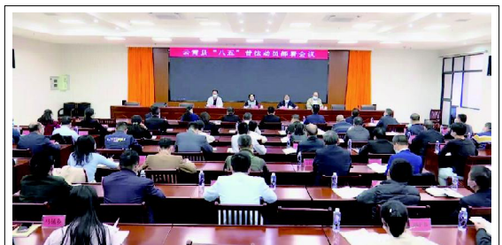
云霄县召开“八五”普法动员部署会