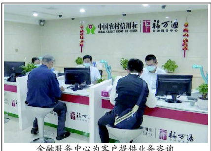
金融服务中心为客户提供业务咨询

截至9月末，我县金融机构人民币存贷款总额374.76亿元，比去年同期增长17.93%，增幅位居全市第二位。其中，人民币各项贷款余额181.31亿元，比去年同期增长21.79%，增幅位居全市第三位。