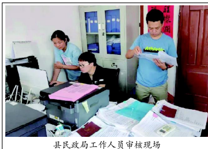
县民政局工作人员审核现场

此次审核确认权限下放工作坚持“简政放权、权限下移、权责对等、提高效率、规范操作、公平公正公开”的原则，实行三级分工，村（居）委会负责定期开展辖区内困难群众排查走访，协助乡镇（开发区）做好城乡低保、特困人员申请受理、入户调查、收入核算、民主评议、公示、审批、动态管理等职责，做好辖区内低保、特困人员动态管理下的“应保尽保、应退尽退”“应养尽养”的工作；县民政局负责城乡