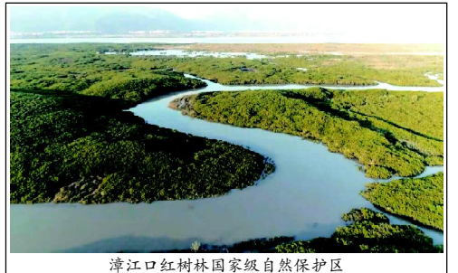
漳州红树林国家级自然保护区

随着保护区生态资源日益优化，以保护区鸟类为例，这几年新发现有白琵鹭、罗纹鸭、鸕，西伯利亚银鸥等鸟类，国家一级重点保护动物黑脸琵鹭数量呈上升趋势，2020-2021年越冬期在保护区范围内同步调查到的黑脸琵鹭数量达20只，是迄今为止保护区的最高纪录，且黑脸琵鹭在保护区停留的时间相比往年也有所增加。