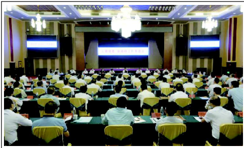
云霄县委、县政府工作务虚会会议现场

本报讯（郭扬 吴锡坤）10月19日至20日，云霄县委、县政府工作务虚会召开，深入贯彻落实市第十二次党代会精神，认真细化深化县第十四次党代会决策部署，深刻分析当前发展面临的形势挑战，将务虚研讨转化为明年乃至“十四五”时期全县发展的务实成果，聚智聚力开启富美新云霄现代化新征程。