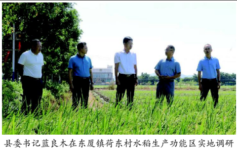
县委书记蓝良木在东厦镇荷东村水稻生产功能区实地调研

扛稳保障国家粮食安全的政治责任，切实守好人民群众“米袋子”，牢牢稳住粮食安全“压舱石”。