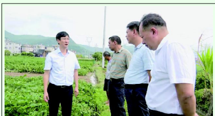
副市长兰万安现场协调解决农户遇到的困难和问题

本报讯(朱淮杰) 为确保秋季粮食丰产丰收,副市长兰万安深入东厦镇(福建省粮食产能区)示范点,调研水稻、毛豆、玉米、甘薯等生产基地,详细了解秋季粮食生产、农机推广、农业机械配置等情况,现场协调解决农户遇到的困难和问题。代县长沈顺来、副县长蔡权城一同参加调研活动。