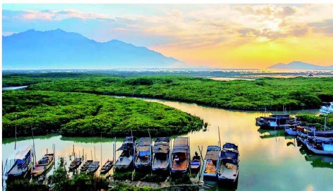
▲漳江口红树林国家级自然保护区