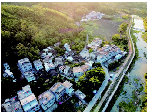
▲坡兜畲族古村落